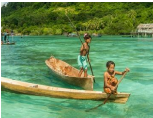
海上吉普賽人—巴天族