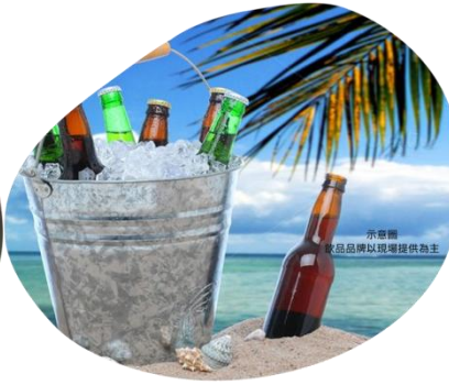
示音標 飲品品牌以現場提供為主