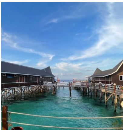
星星水上高腳屋-外觀