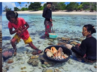
仙本那-現撈海鮮就是王道呀