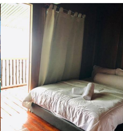
星星水上高腳屋-房間內部