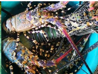
海鮮自由-超平價生蠔