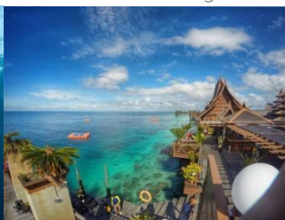
馬布島 Mabul Island