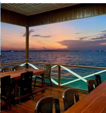
星星水上高腳屋-海上漂浮餐廳