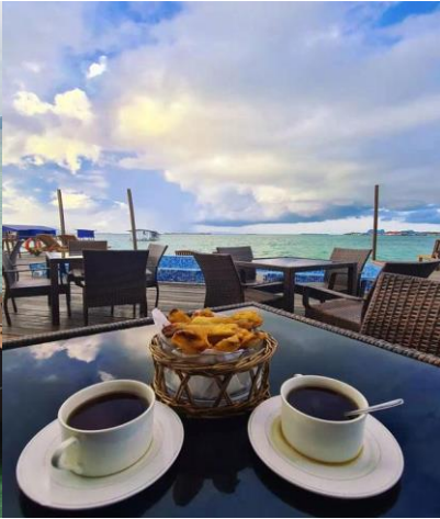
海星水上屋-海上無邊際餐廳