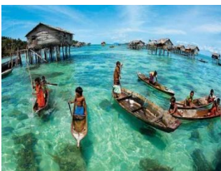
海上吉普賽部落-巴天族