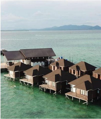
海星水上屋-空景外觀

整個水屋住宿非常舒服，房間裝潢和空間也足夠，餐食的美味提供也是度假村強調的特色之一，透明獨木舟任你玩，最重要是有很棒中文管家接待，提供住客熱情服務。