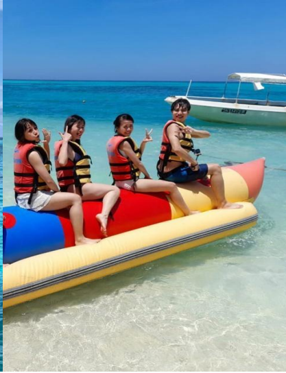
香蕉船巡弋一次搭乘