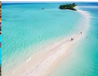
馬達京島 Mataking Island