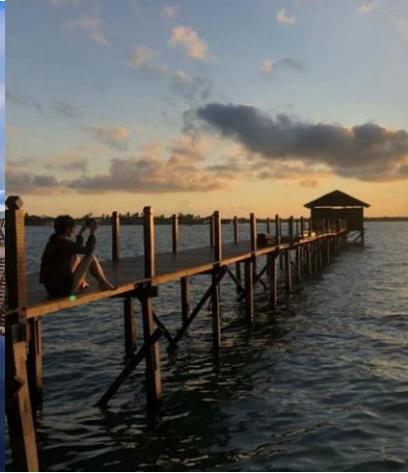
海星水上屋-夕陽餘暉迷人精緻